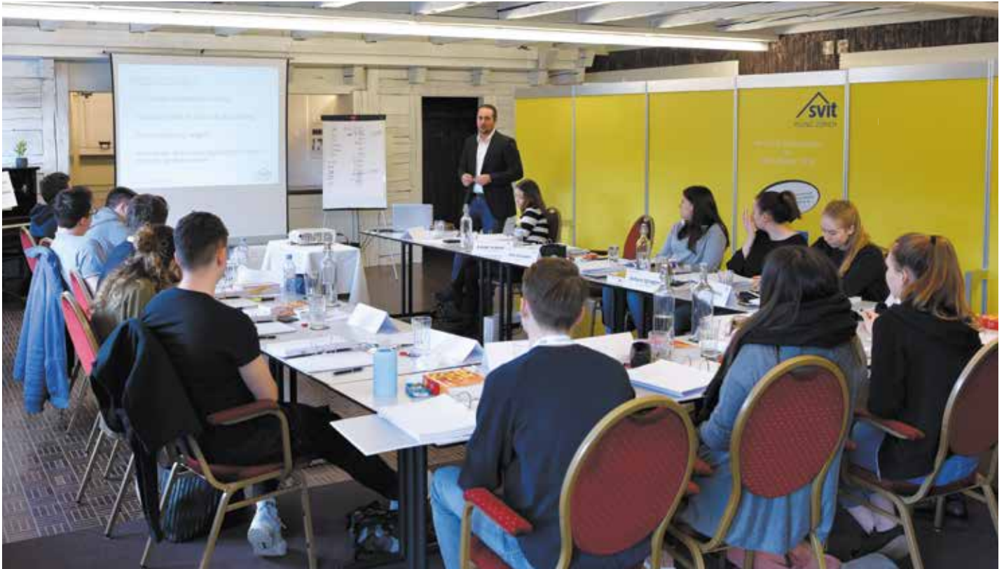
Die Lernenden repetieren in einem vielseitigen und dynamischen Unterricht den Branchen-Stoff für die Branchen-Qualifikationsprüfung.

Bereits zum zweiten Mal hat der SVIT-Young den QV-Campus in Beckenried am Vierwaldstättersee mit 30 Lernenden durchgeführt. Ziel des dreitägigen Lagers ist es, die Lernenden optimal auf die Branchen-Qualifikationsprüfung 2018 vorzubereiten.