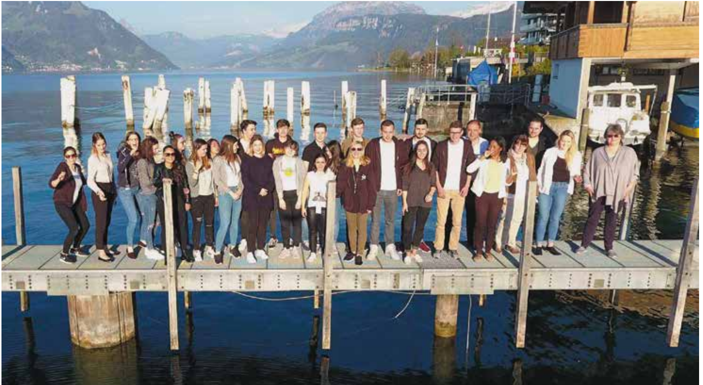
Ausgelassene Stimmung am QV-Campus 2017 in Beckenried.

Die Förderung von qualifiziertem Nachwuchs ist auch in der Immobilienbranche eine Herausforderung. Mit der Gründung der Jugendkommission SVIT Young hat der SVIT Zürich ein Gremium zur gezielten Ansprache von jungen Immobilienleuten geschaffen.