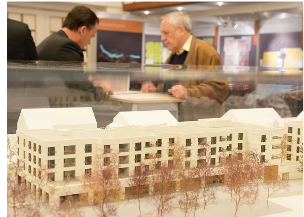
Künftiges Wohneigentum wird mit Modellen visualisiert.