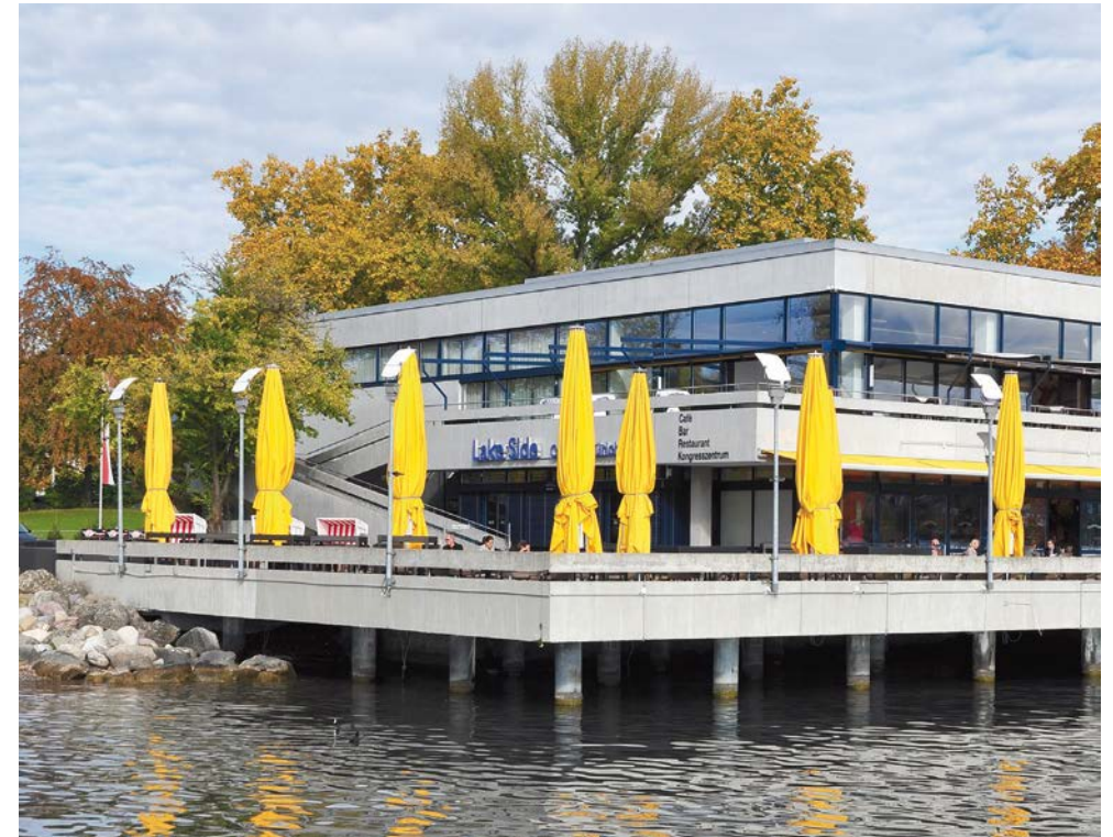
Zum ersten Mal findet die Messe im «Lake Side» direkt am Zürichsee statt.