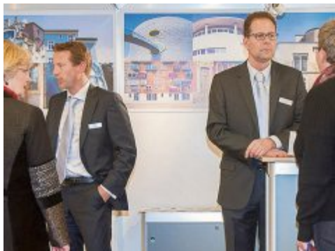
Das Verkaufsteam des HEV Zürich ist auch 2015 wieder vor Ort.