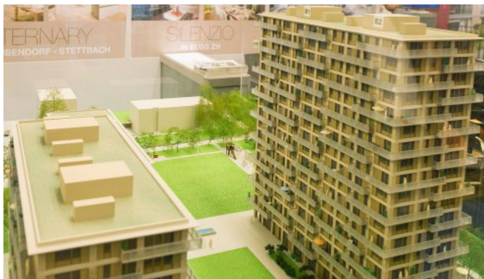
Modelle geben einen Eindruck von künftigen Wohneigentum.

Weiter gibt es auch spannende Informationen über künftige Projekte, welche auf den Internetportalen noch nicht ersichtlich sind. Dadurch bietet sich die Möglichkeit, unter den ersten Interessenten eines spannenden Wohnprojektes zu sein. ■